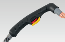
Antorcha MT-70 manual 70 A (50%) 6 m - 037502 12 m - 037519