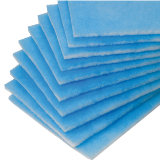
Prefiltros, set de 10 unidades Producto No.: 10032