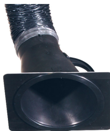
Placa-tobera para campana de aspiración 150 mm