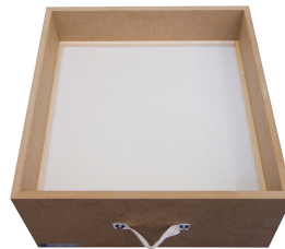
Filtro de partículas H13 superficie: 19,8 m 2