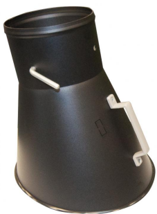
Campana metálica de aspiración, diám. 150 mm