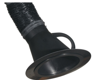
Placa tobera para campana de aspiración diám.150mm