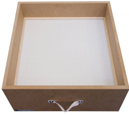
Casete de filtración F9 610 x 610 x 292 mm