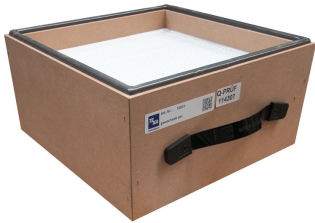
Filtro de partículas H13, 305x305x150 (+2*6)