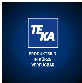
Prefiltros M5 268x268x20 mm azul/blanco 10 uds.