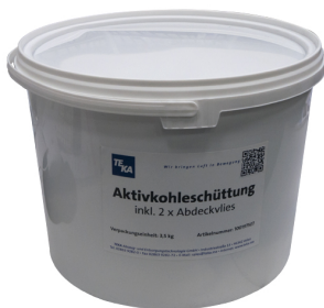
Carbón activo a granel, recarga de 3,5 kg