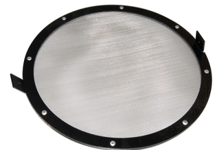
Rejilla de protección (malla fina) para montar Producto No.: 10372