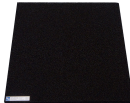
Filtro de carbón activo Producto No.: 978006