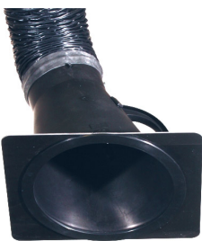
Placa-tobera para campana de aspiración 150 mm Producto No.: 66210