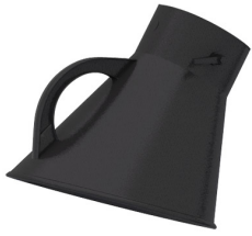
Campana de aspiración, DN 150 mm Producto No.: 66200