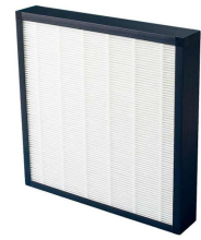
Prefiltro para filtroo y ViroLine y AirToo Producto No.: 978004