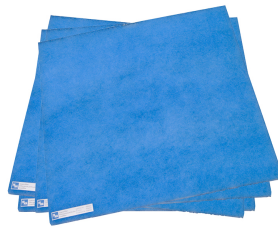
Filtro grueso set, 10 unidades Producto No.: 978003